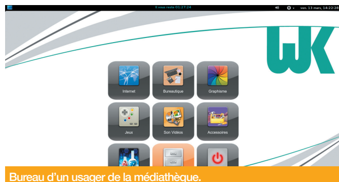
Bureau d'un usager de la médiathèque.

Le succès de cette solution tient à sa simplicité d'utilisation et de maintenance. Le bibliothécaire paramètre facilement le système WebKiosk, depuis une interface Web, afin d'offrir aux usagers un accès sécurisé aux dernières versions des logiciels proposés dont notamment le navigateur Firefox, la suite bureautique LibreOffice, le logiciel multimédia VLC ou encore le logiciel de retouche photo Gimp... Il lui suffit de choisir les applications qui sont proposées sur chaque poste dans un catalogue convivial et exhaustif qui